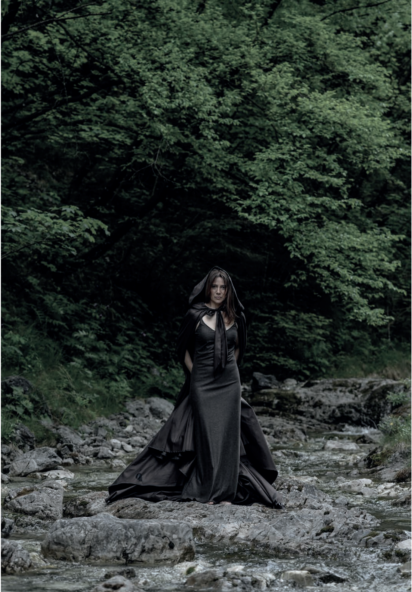
Fermo immagine tratto dal video VIVA.