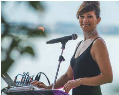
Terme di Sirmione 2017