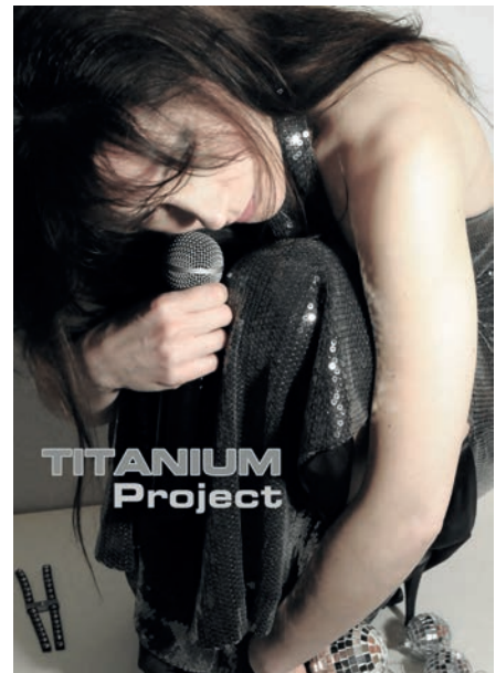
New York 2001 e Titanium Project 2010